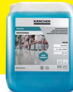
FloorPro industriereiniger RM 69

Kärcher adviseert verschillende reinigingsmiddelen voor de KIRA B 50 schoonmaakrobot, afhankelijk van de vervuilingsgraad, de plaats van toepassing en de betreffende vloerafwerking - uiteraard allemaal perfect afgestemd op de machine, gebruiksveiligheid en het milieu.