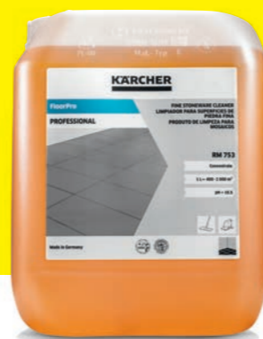
FloorPro reinigingsmiddel voor keramische tegels RM 753