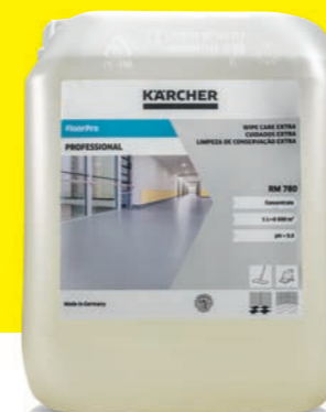
FloorPro onderhoudsreiniger Extra RM 780