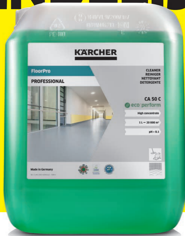
FloorPro reiniger CA 50 C eco!perform