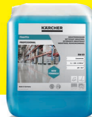
Détergent industriel FloorPro RM 69

En fonction du degré de salissure, du lieu d'utilisation et du revêtement de sol, Kärcher recommande différents détergents avec le robot de nettoyage KIRA B 50, tous évidemment parfaitement compatibles, sûrs et écologiques.