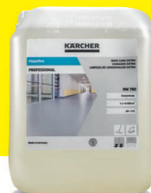
Mop cleaner Extra FloorPro RM 780