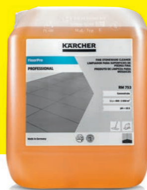
Nettoyant pour grès cérame fin FloorPro RM 753