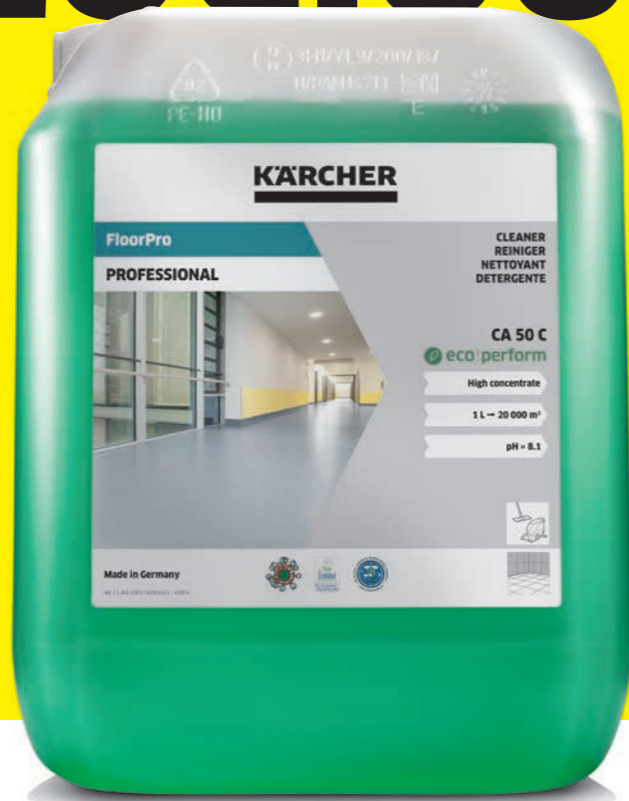
Détergent FloorPro CA 50 C eco!perform